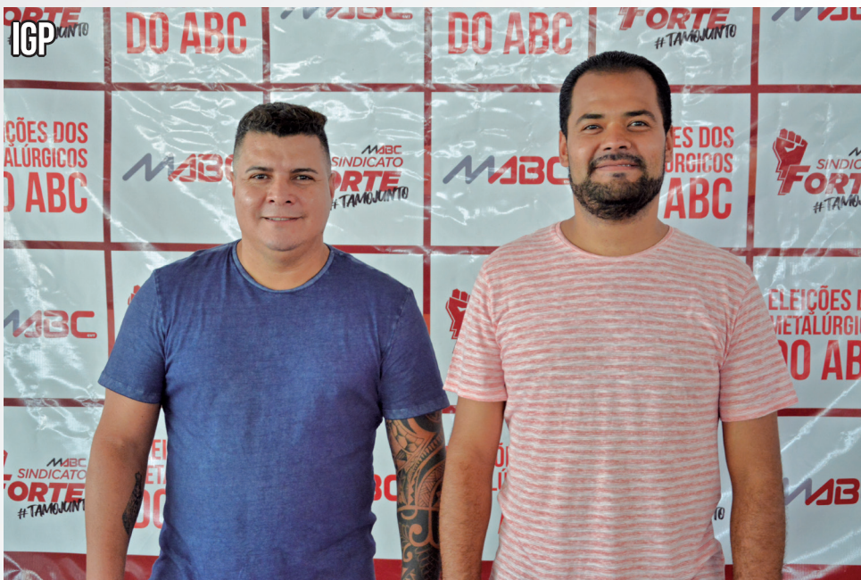
Da Lua e Trakinas