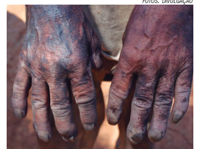
Um país de retrocessos

Relatório da Anistia Internacional aponta que 2019 foi marcado por retrocessos para os direitos humanos no Brasil. O levantamento mapeou 24 países.