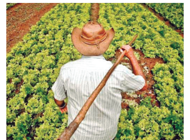
Golpe na reforma agrária

A luta é pelo reconhecimento da originalidade do território, pela preservação da natureza e do Nhanderekó Guarani (modo de vida e cultura).