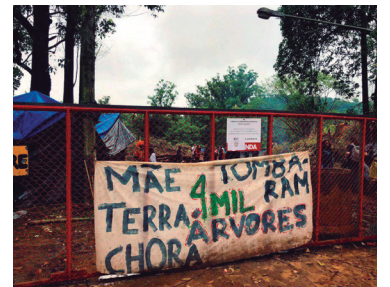
Luta dos guaranis 2

Guaranis acampados no terreno da Tenda no Jaraguá reivindicam o embargo da obra no local onde uma construtora quer fazer 5 torres de moradias populares.