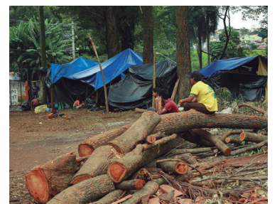
Luta dos guaranis 1

Relatório da Anistia Internacional aponta que 2019 foi marcado por retrocessos para os direitos humanos no Brasil. O levantamento mapeou 24 países.